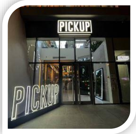
مطعم بيك أب