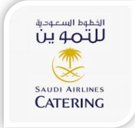
الخطوط السعودية للتموين