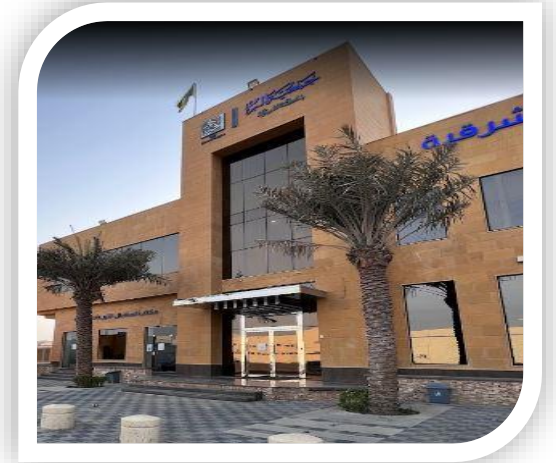
جمعية البر بالمنطقة الشرقية دار الخير